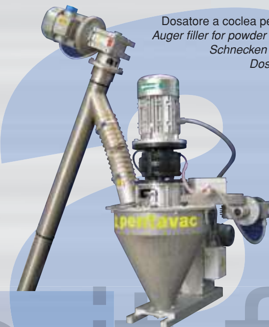
Dosatore a coclea per polveri Auger filler for powder products Schnecken Dosierer Doseur à vis