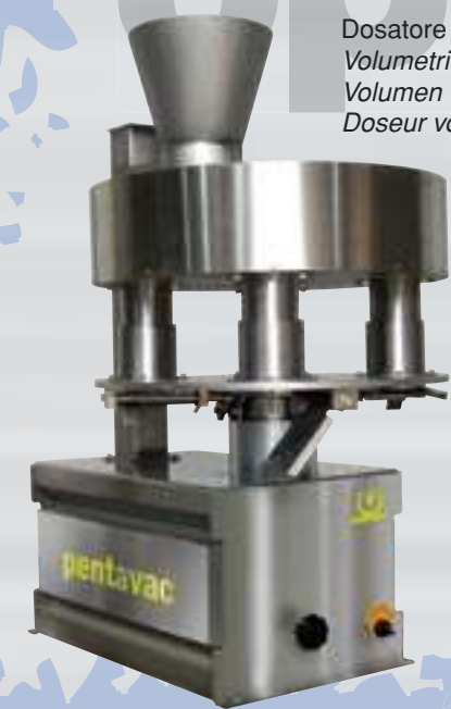
Dosatore volumetrico Volumetric cup filler Volumen Dosierer Doseur volumétrique

Penta 3100TS und Penta 4200TS sind das Ergebnis der Erfahrung von hunderten Maschinen, die auf Grund eines direkten Kontakts mit der Kundschaft geschaffen worden sind. Anlässlich des zehnjährigen Jubiläums der Firma Pentavac möchten wir allen unseren 500 Kunden auf der ganzen Welt danken, die uns gewählt haben. Besonderen Dank gilt denjenigen die uns die Erlaubnis gegeben haben, Fotos ihrer Produkte in unserem Katalog aufzunehmen.