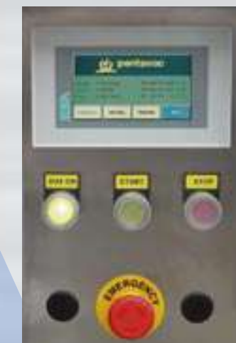
Pannello di controllo Touch Screen a colori Color control panel Panneau operateur à couleurs Touch Screen Farbe Bedienungsfeld