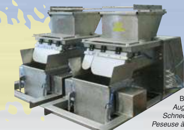
Bilancia a coclea Auger weigher Schnecken Dosierwaage Peseuse à vis