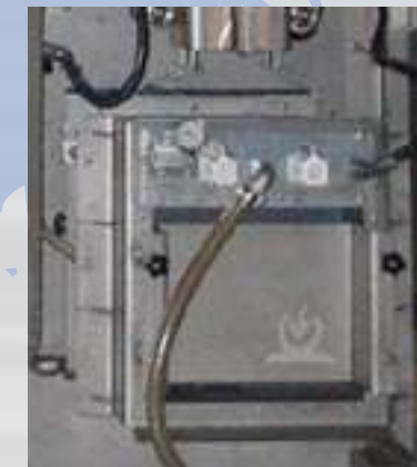
Campana per il vuoto Vacuum chamber Vakuum Werkzeug Chambre à vide