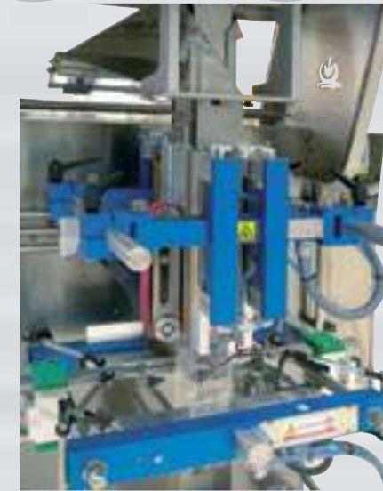
Dispositivo per buste a quattro saldature Four side seal device Vierpunkt Siegelanlage Dispositif pour la réalisation de sachets avec quatre soudures